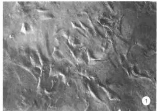
图 1 对照组软骨细胞 F12 培养液中不含 CSA \times 250

分别含 20, 10, 5 mg/mL 的 CSA 的条件培养液对软骨细胞的生长无明显影响, 实验组和对照组软骨细胞的形态及大小均未见明显差异 (图 1, 2) 用 MTT 法测得的光密度值 ( D 值) 与对照组差异无显著性 ( P > 0.05 , 表 1)。